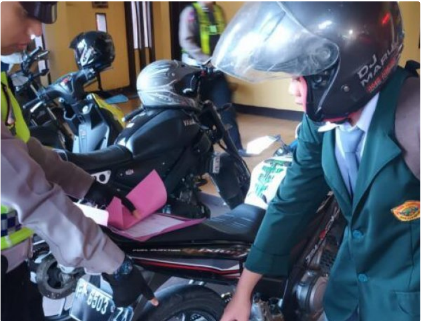
Polsek Cisaat Polres Sukabumi Kota

Kota Sukabumi – Polres Sukabumi Kota Polda Jawa Barat – Unit Lalulintas Polsek Cisaat Polres Sukabumi Kota setiap hari, melaksanakan sosialisasi dan penertiban knalpot brong atau knalpot tidak sesuai dengan spesifikasi Hal ini untuk mencegah penggunaan knalpot brong dikalangan pelajar, Selasa